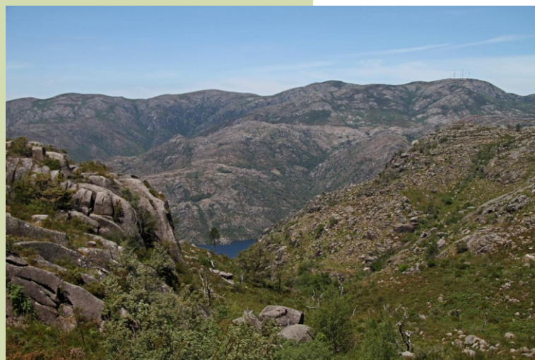
Vista cara ao oeste, sobre o encoro de Vilariño das Furnas e a serra de Santa Eufemia