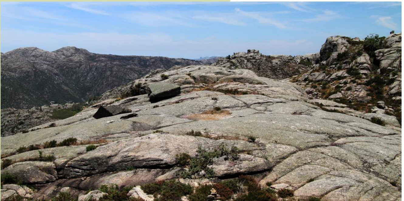
Vista cara ao noroeste, con santa Eufemia (á esquerda) e a pena de Anamão, no Laboreiro