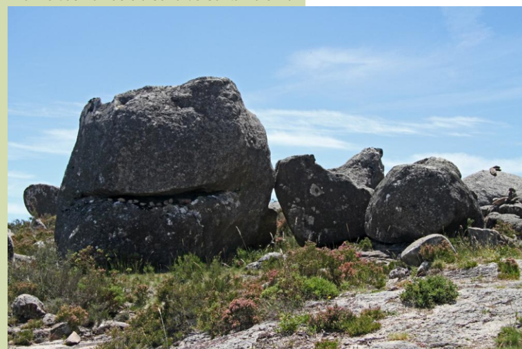
“Monstruos” nos cumes