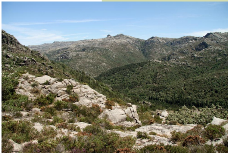
Vista cara ao leste, coa Fraga de Albergaría e o Pé da Moega