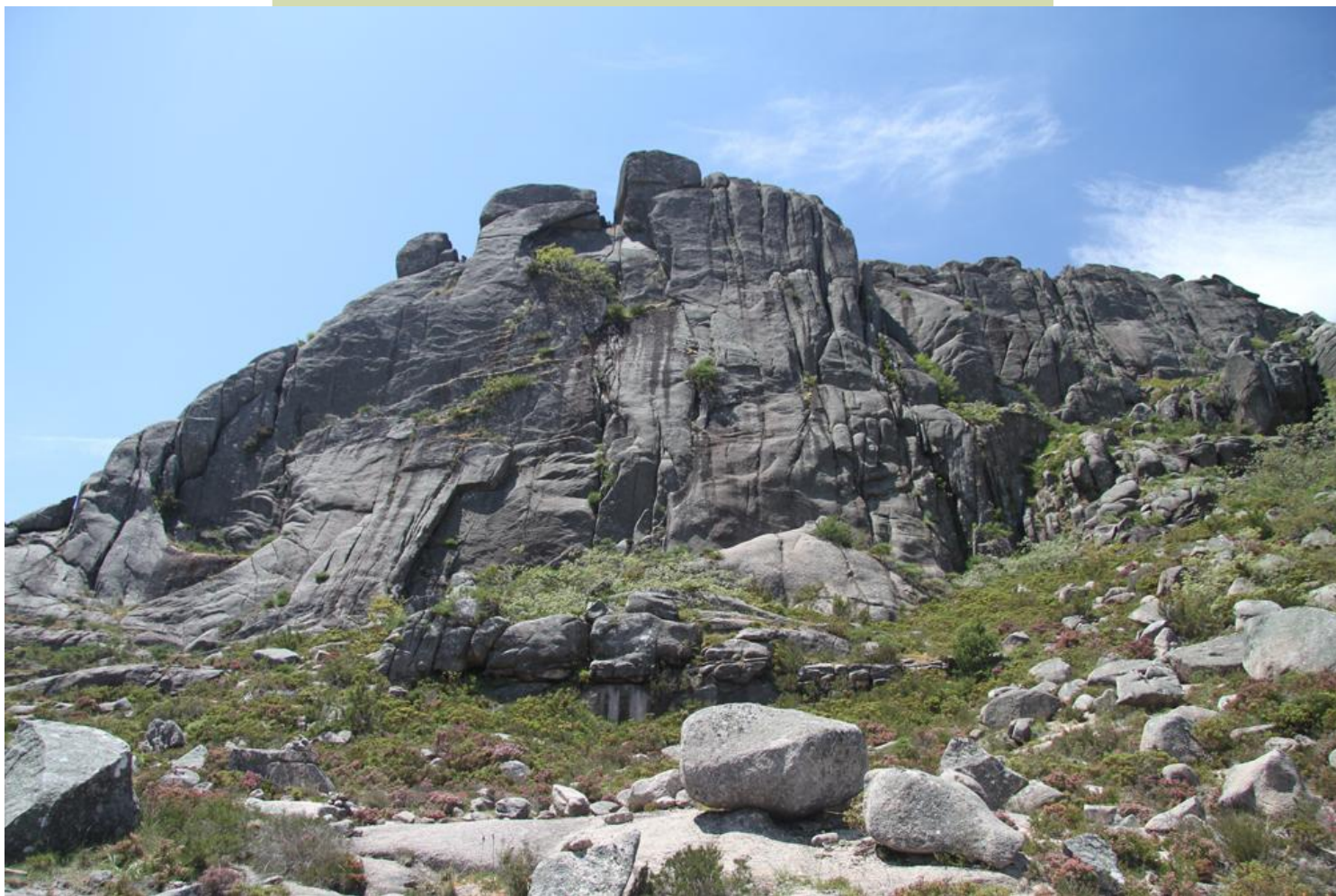
Cara leste o Pé do Cabril